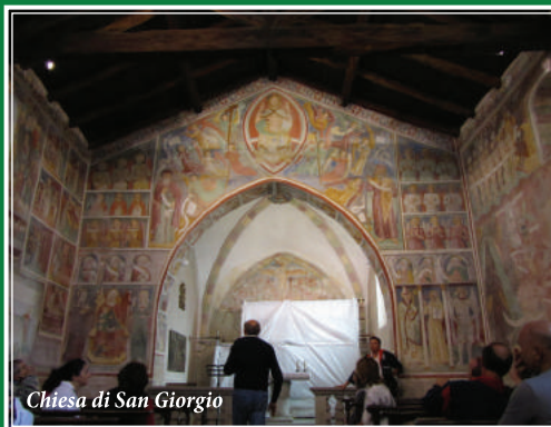
Chiesa di San Giorgio

Ritorno alla Stazione FS di Abbazia Lariana percorrendo il sentiero del Viandante